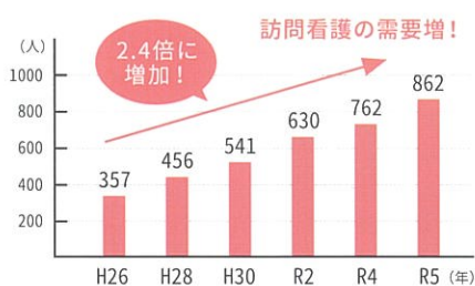
福岡県訪問看護ステーション届出数

厚生労働省によると、2025年には団塊の世代の方々が全て75歳以上となり、医療従事者の需要はさらに高まるとされています。それに伴い訪問看護のニーズもより一層高まり、 訪問看護従事者においては最大約12万人必要との推計値が示されています(2019年の試算)。